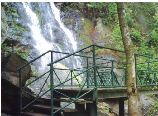
No curso médio do rio ele exibe monumentos importantes, como a cachoeira de Natuba

Em 1731, no auge da produção açucareira, o Paraíba mete outra cheia e abala as algibeiras dos comerciantes portugueses, que monopolizavam o comércio do açúcar na Europa. Em 1789 outra inundação trouxe uma misteriosa cruz, que enalhou onde hoje é Cruz do Espírito Santo. Esta serviu para dar origem ao nome do município. Em 1924, além de Cruz do Espírito Santo o Paraíba levou o engenheiro Saboiera, a Ponte da Batalha e inundou outras cidades vizinhas. Em 1984 riscou Cruz do Espírito Santo do mapa e quase repete a dose em 2004, com uma grande enchente. Em 1506, no ano de seu descobrimento, o Rio Paraíba se tornou conhecido em Portugal a partir de novembro, quando uma multidão de católicos