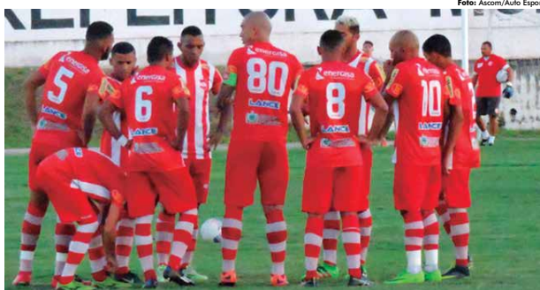
Apesar da baixa campanha no Paraibano da atual temporada, o Auto Esporte focará seu calendário nos próximos dois meses

A falta de recursos financeiros é um problema que tem afetado muito o Auto Esporte e sua diretoria já pensa em ter que viver com esta mesma situação na temporada de 2018. Isto, no entanto, foi o que inviabilizou o time a chegar ao G4 do Paraibano de 2017, na opinião do seu presidente. "Não iríamos gastar demasiadamente para depois não termos condições de pagar. Sempre trabalha-