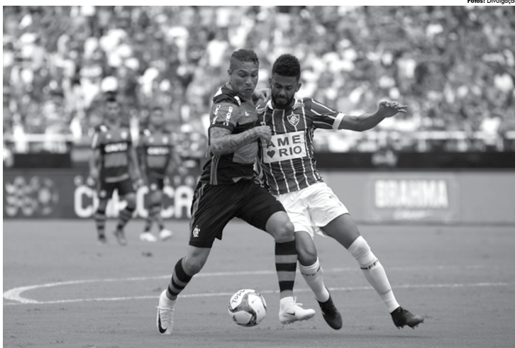
As duas melhores equipes na atualidade do Rio de Janeiro chegaram à final, depois de duas semifinais, após deixarem para trás Vasco e Botafogo