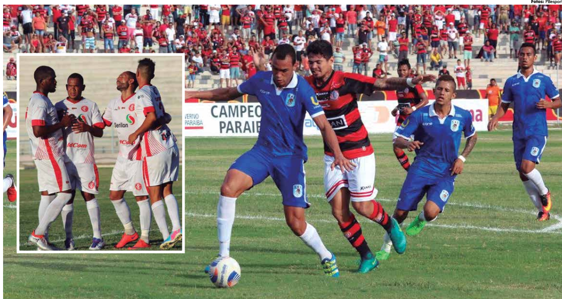
O CSP passa por reavaliação dos seus dirigentes, enquanto situação do Internacional-FB é pior, já equipe que foi rebaixada e só retorna ao futebol profissional no segundo semestre do próximo ano, na 2ª Divisão