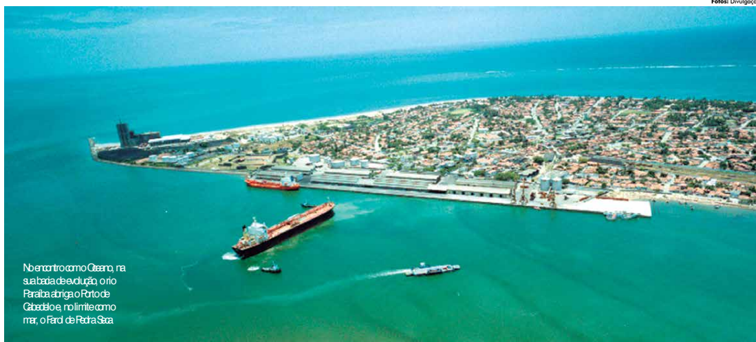
No encontro com o mar, na sua bacia de evolução, o rio Paraíba abraça o Porto de Cabedelo e, no limite com o mar, o Farol de Pedra Seca