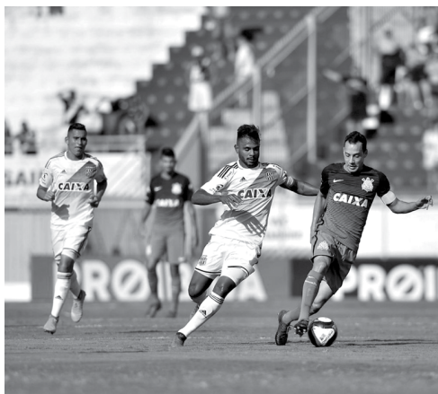
A Ponte faz primeira partida em Campinas e obter bom resultado é a meta dos seus jogadores

chance de obter o Estadual, após 9 anos quando ficou com o vice, em 2008. O Corinthians vai ao interior com a base dos últimos jogos, com a intenção de vencer, mas o empate será bem recebido pelos jogadores e comissão técnica. O treinador Fábio Carille reconhece que serão dois jogos complicados, com um adversário que tirou o Palmeiras, considerado um dos candidatos ao título. "Tentaremos parar o ímpeto do adversário em seus domínios para trazer um resultado positivo ou até mesmo um empate".