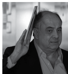
Mascarenhas fez piada até como interrogador