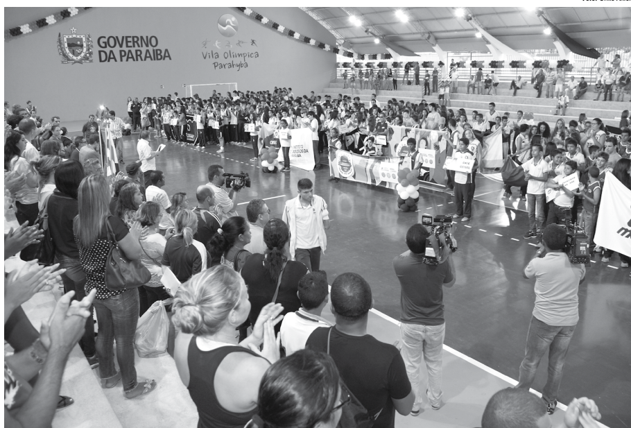
Exemplo de anos anteriores, a abertura dos Jogos Escolares vai acontecer no ginásio principal da Vila Olímpica Parahyba com atletas de redes de ensino estadual, municipal e privada